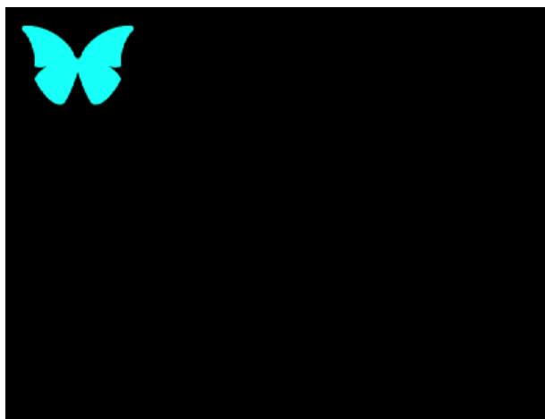
Le résultat final (image réduite)

L'Amiga a sa Boing Ball, MorphOS a maintenant son Flying Morpho ! ^^